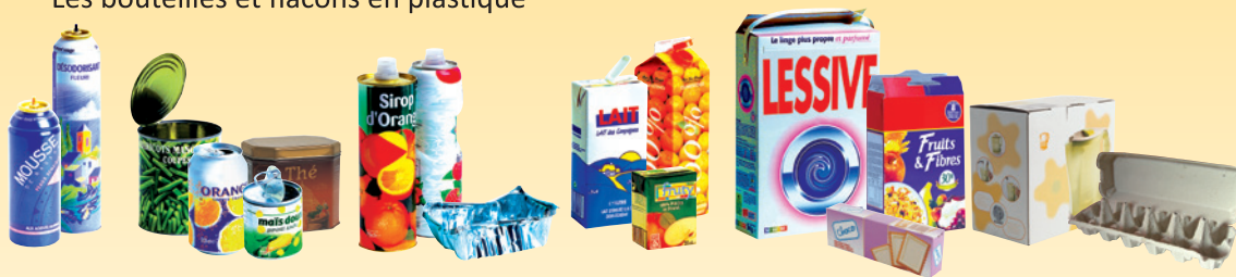
Les emballages métalliques, les briques alimentaires, les emballages en carton