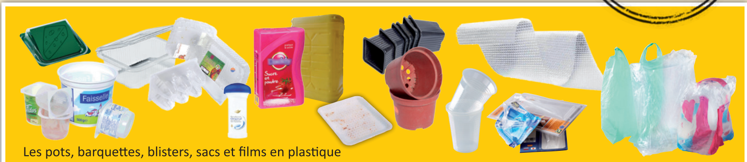
Les pots, barquettes, blisters, sacs et films en plastique