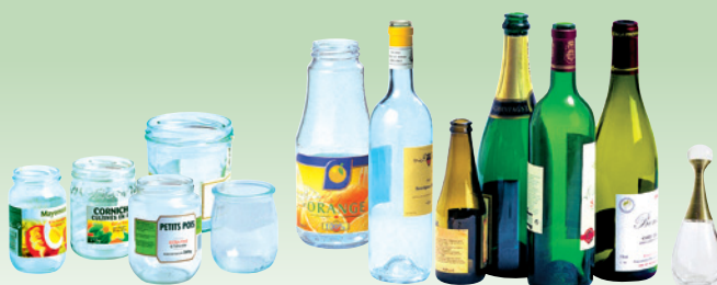
Les pots, bocaux, bouteilles et flacons de parfum