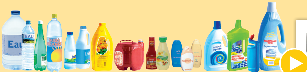
Les bouteilles et flacons en plastique